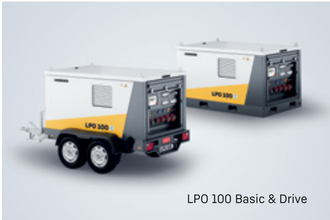
LPO 100 Basic & Drive