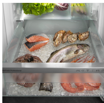
Příhrádka na ryby a mořské plody

Křupavý salát nebo jahody: Nejcitlivější potraviny si zaslouží zvláštní místo, aby zůstaly déle čerstvé: Příhrádky BioFresh. V příhrádce na ovoce a zeleninu se teplota blíží 0 °C. V kombinaci s vlhkostí vzduchu, která v této příhrádce převládá, a díky jejímu těsnému uzavření je zde nebalenému ovoci a zelenině obzvláště dobře. Nemusíte nic nastavovat.