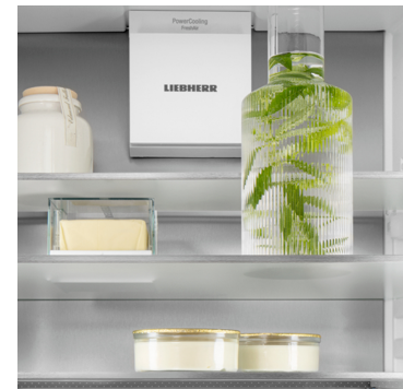
SmartSteel hátsó fal

Liebherr készüléke figyel minden ujjmozdulatára: a Touch & Swipe kijelzőnek köszönhetően intuitív módon és könnyedén kezelheti hűtőszekrényét. A funkciók (pl. „SuperCool”) érintéssel és sepréssel egyszerűen kiválaszthatók a színes kijelzőn. Ugyanilyen könnyen szabályozhatja a hőmérsékletet is. De mi történik, ha éppen nem használja a kijelzőt? Akkor a tényleges hőmérséklet látható rajta.