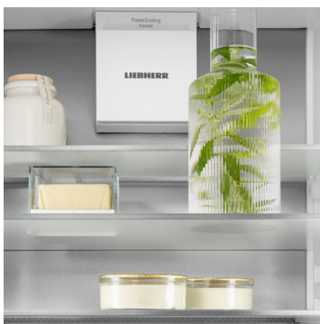
Paroi arrière SmartSteel

Vous souhaitez que votre filet de veau tendre ou que votre lait frais le reste le plus longtemps possible ? Les compartiments BioFresh en sont la garantie : la température dans le compartiment DrySafe avoisine les 0 °C, ce qui représente des conditions de stockage idéales pour les aliments les plus sensibles. Et le meilleur reste à venir : tout est parfaitement réglé d'usine pour une utilisation immédiate, et une fraîcheur encore plus longue.