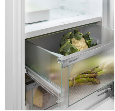
Fruit & Vegetable rekesz

Úgy kívánja hűteni a gyümölcsöket és a zöldségeket, akár a profik? A HydroBreeze le fogja nyugtázni: a hideg köd a rekeszben uralkodó, kicsivel 0 °C feletti hőmérséklettel együtt biztosítja az élelmiszerek extra hosszú eltarthatóságát. Emellett nagyszerű látványt nyújt. A HydroBreeze 90 percenként bekapcsol 4 másodpercre, ajtónyitás esetén pedig 8 másodpercre.