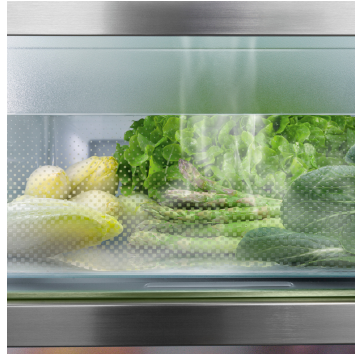
BioFresh + HydroBreeze

A BioFresh Professional rekesz további frissességet biztosít az élelmiszereknek a hosszú eltarthatóság érdekében – egy lenyűgöző funkcióval: A HydroBreeze-nek köszönhetően egy hűvös köd takarja be védőbalsamként a gyümölcsöket és zöldségeket. A 0 °C feletti hőmérséklet és a magas páratartalom ideális környezet a csomagolatlan gyümölcsök és zöldségek számára.