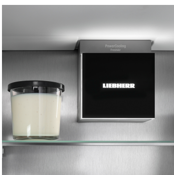
Osvětlení pro příjemnou atmosféru

Váš Liebherr je v kuchyni – ale pokud chcete, může být také kdykoli na internetu: Integrovaný SmartDeviceBox otevírá dveře všem výhodám Smart Home. Jednoduše zastrčte do zásuvky, zapněte a připojte svůj Liebherr k síti přes WLAN.