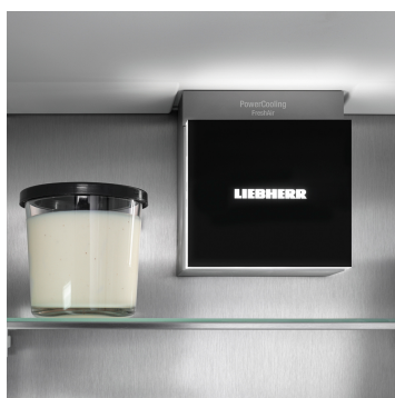
Osvětlení pro příjemnou atmosféru

Váš Liebherr je v kuchyni – ale pokud chcete, může být také kdykoli na internetu: Integrovaný SmartDeviceBox otevírá dveře všem výhodám Smart Home. Jednoduše zastrčte do zásuvky, zapněte a připojte svůj Liebherr k síti přes WLAN.