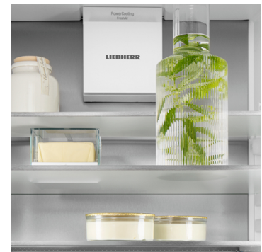
SmartSteel hátsó fal

Liebherr készüléke figyel minden ujjmozdulatára: a Touch & Swipe kijelzőnek köszönhetően intuitív módon és könnyedén kezelheti hűtőszekrényét. A funkciók (pl. „SuperCool”) érintéssel és sepréssel egyszerűen kiválaszthatók a színes kijelzőn. Ugyanilyen könnyen szabályozhatja a hőmérsékletet is. De mi történik, ha éppen nem használja a kijelzőt? Akkor a tényleges hőmérséklet látható rajta.