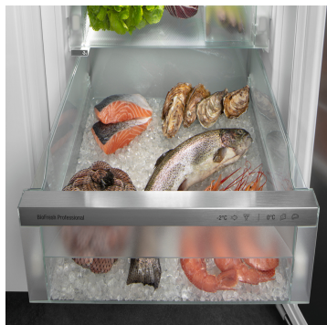
Fish & Seafood-Safe

Vous aimez le poisson ? Il reste frais dans votre Liebherr ! Car dans le compartiment Fish & Seafood, le poisson et les fruits de mer sont conservés à la température optimale de -2 °C, de façon aussi professionnelle que chez le poissonnier. Réglez la taille de la zone -2 °C comme vous le souhaitez, et conservez la viande et les produits laitiers à une température optimale de 0 °C dans l'espace restant. Un affichage LED vous indique que la zone -2 °C est active.