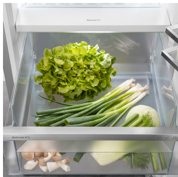
Compartiment Fruit & Vegetable

Votre Liebherr se trouve bien évidemment dans votre cuisine, mais si vous le souhaitez, il peut aussi aller sur Internet à tout moment. La SmartDeviceBox intégrée ouvre la porte à tous les avantages de votre Smart Home. Il suffit de la brancher, de l'allumer et de connecter votre Liebherr au réseau via le réseau Wifi.