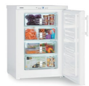
GP 1486 Premium