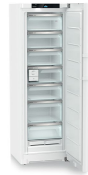
FNd 525i Prime