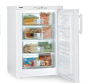
GP 1376 Premium