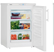
G 1223 Comfort