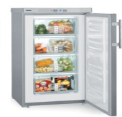
GPesf 1476 Premium