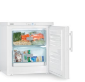
GX 823 Comfort