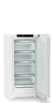
FNe 4224 Plus