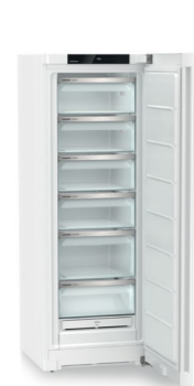
FNe 5026 Plus