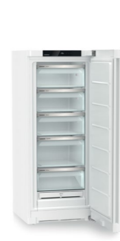
FNe 4625 Plus