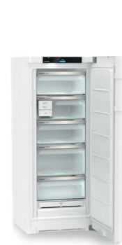
FNC 4675 Peak