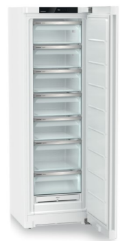
FNe 5227 Plus