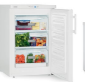
GP 1213 Comfort