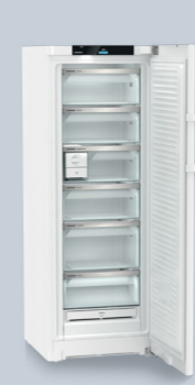
FNb 5056 Prime