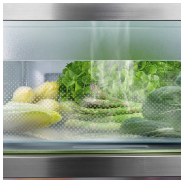
BioFresh s HydroBreeze

Příhrádka BioFresh Professional dodává potravinám extra čerstvost pro dlouhodobé skladování: Díky funkci HydroBreeze pokryje ovoce a zeleninu jako ochranný povlak studená mlha. V kombinaci s teplotou lehce nad 0 °C a vysokou vlhkostí se zde ovoce a zelenina bez obalu cítí skutečně dobře.