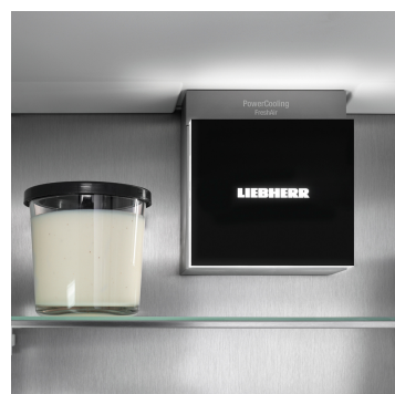
Osvětlení pro příjemnou atmosféru

Váš spotřebič Liebherr Vám ponechá volnou ruku: Díky systému AutoDoor můžete otevírat poklepáním nebo hlasovým příkazem. Je tak první chladničkou na světě, která se plně automaticky otevírá a zavírá – dokonalost kuchyně bez úchytů. Rychlost a úhel otevření a také dobu do jejího zavření si zvolíte sami. A v případě potřeby můžete stejně snadno otevírat a zavírat rukou nebo pomocí chytrého telefonu.