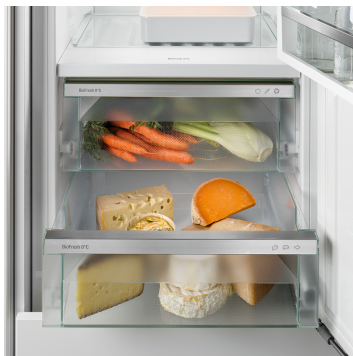
Příhrádka na maso a mléčné výrobky

Křupavý salát nebo jahody: Nejcitlivější potraviny si zaslouží zvláštní místo, aby zůstaly déle čerstvé: Příhrádky BioFresh. V příhrádce na ovoce a zeleninu se teplota blíží 0 °C. V kombinaci s vlhkostí vzduchu, která v této příhrádce převládá, a díky jejímu těsnému uzavření je zde nebalenému ovoci a zelenině obzvláště dobře. Nemusíte nic nastavovat.