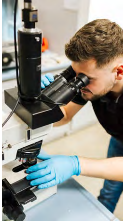
Desarrollo y construcción

La combinación de todas estas competencias es la base del desarrollo continuo de nuestra gama ofertada.