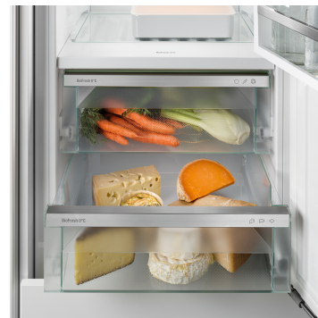
Příhrádka na maso a mléčné výrobky

Křupavý salát nebo jahody: Nejcitlivější potraviny si zaslouží zvláštní místo, aby zůstaly déle čerstvé: Přihrádky BioFresh. V přihrádce na ovoce a zeleninu se teplota blíží 0 °C. V kombinaci s vlhkostí vzduchu, která v této přihrádce převládá, a díky jejímu těsnému uzavření je zde nebalenému ovoci a zelenině obzvláště dobře. Nemusíte nic nastavovat.