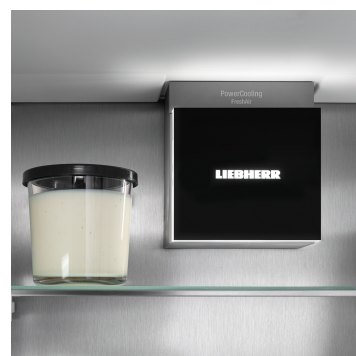
Osvětlení pro příjemnou atmosféru

Váš spotřebič Liebherr Vám ponechá volnou ruku: Díky systému AutoDoor můžete otevírat poklepáním nebo hlasovým příkazem. Je tak první chladničkou na světě, která se plně automaticky otevírá a zavírá – dokonalost kuchyně bez úchytů. Rychlost a úhel otevření a také dobu do jejího zavření si zvolíte sami. A v případě potřeby můžete stejně snadno otevírat a zavírat rukou nebo pomocí chytrého telefonu.