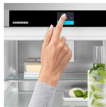
Display Touch & Swipe

Vi piace l'eleganza in cucina? In tal caso, un'apparecchiatura Liebherr con superficie SteelFinish è perfetta per voi. L'aspetto è molto simile a quello dell'acciaio inox, robusto e facile da pulire. I fianchi verniciati color silver conferiscono raffinatezza all'apparecchiatura.