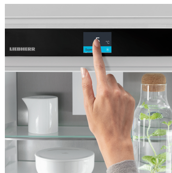
Touch & Swipe kijelző

Az optimálisan megvilágított belső térben örömet fogja lelni: a LightTower elemek előtérbe helyezik az élelmiszereket, és úgy vannak elhelyezve, hogy mindig maradéktalanul megvilágítsák a feltöltött hűtőszekrényt. Mivel a LightTower elemek az oldalfalak síkjában vannak beépítve, több hely marad az élelmiszerek számára.