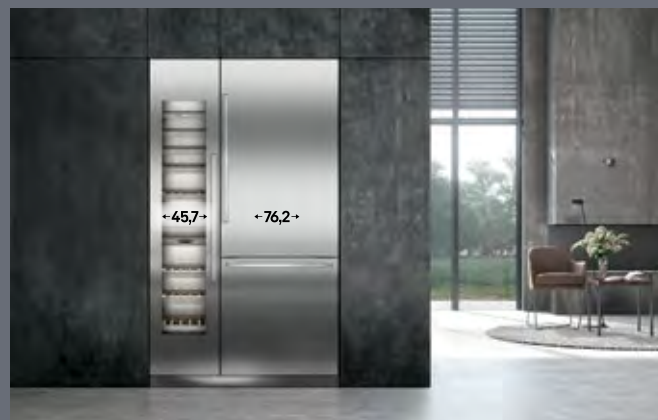
Largura do recorte: 121,9 cm