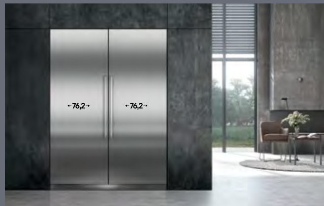
Largura do recorte: 152,4 cm