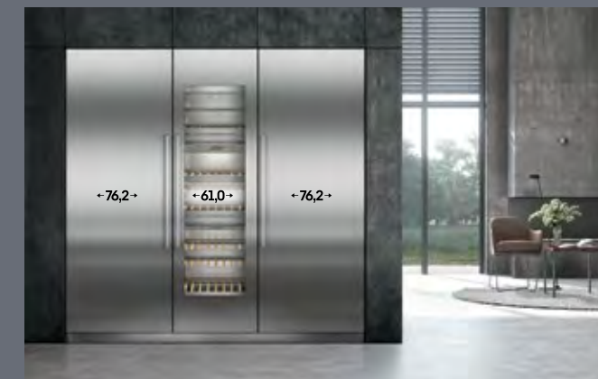
Largura do recorte: 213,4 cm