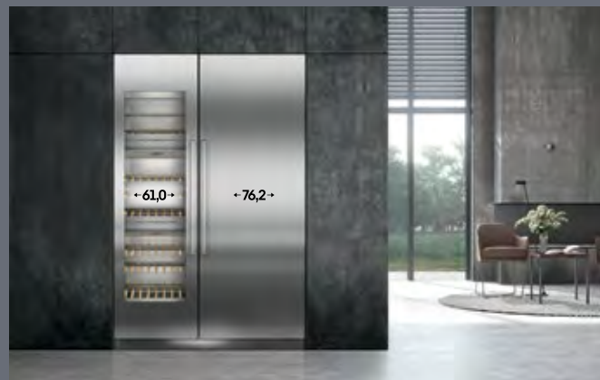
Largura do recorte: 137,2 cm