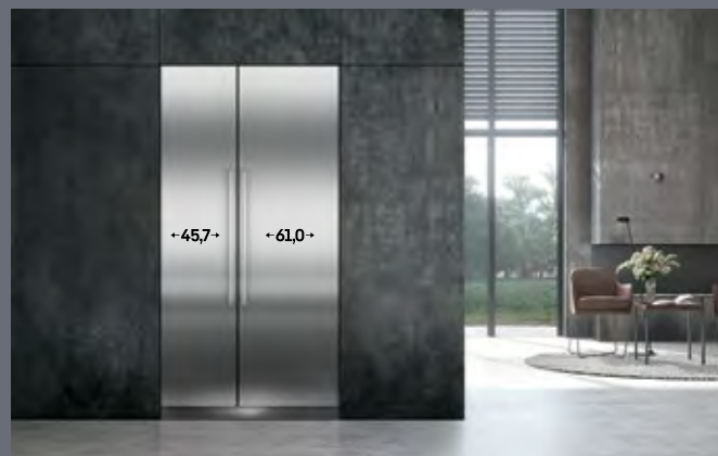
Largura do recorte: 106,7 cm