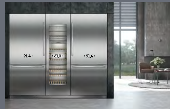
Largura do recorte: 243,8 cm