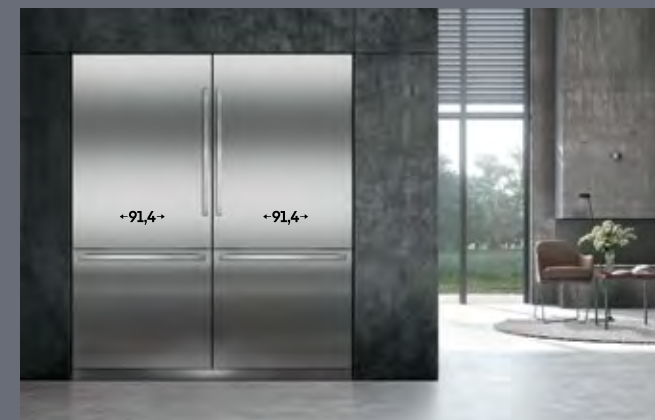
Largura do recorte: 182,9 cm