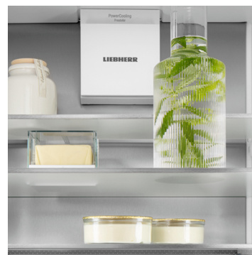
Parete posteriore in SmartSteel

Con un tocco ottieni ciò che vuoi: con il display Touch & Swipe eseguirai i comandi del tuo frigorifero in modo semplice e intuitivo. Per selezionare le funzioni come "SuperCool" basta premere e sfiorare i comandi sul display a colori. E con la stessa facilità regoli anche la temperatura. Cosa succede se non intervieni direttamente sul display? In questo caso esso ti mostrerà la temperatura effettiva.