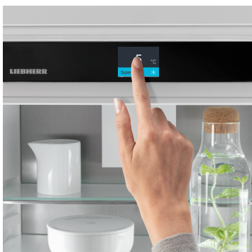
Touch & Swipe kijelző

Az optimálisan megvilágított belső térben örömet fogja lelni: a LightTower elemek előtérbe helyezik az élelmiszereket, és úgy vannak elhelyezve, hogy mindig maradéktalanul megvilágítsák a feltöltött hűtőszekrényt. Mivel a LightTower elemek az oldalfalak síkjában vannak beépítve, több hely marad az élelmiszerek számára.