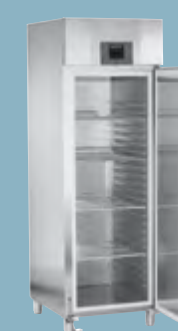
Lodówki szafkowe do mięsa lub ryb