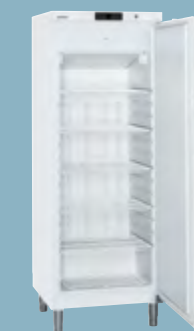
Szafki Click & Collect

Oprócz specjalnych urządzeń dla detalicznego handlu spożywczego, firma Liebherr dba także o inne obszary supermarketu. Na scenie i za kulisami chłodziarki i zamrażarki Liebherr dbają o to, by umożliwić Ci spełnienie wszelkich upodobań Twoich klientów.