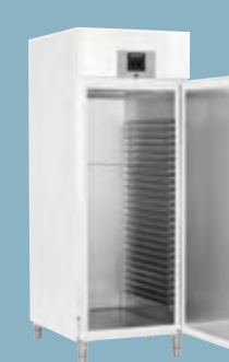
Urządzenia szafkowe na zapleczu