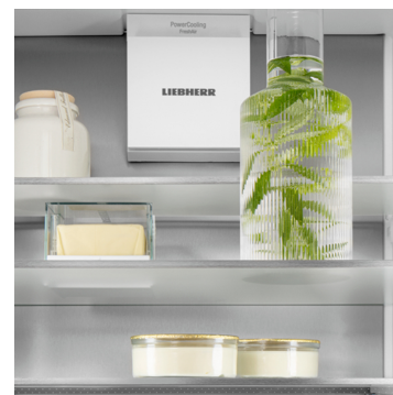
Parete posteriore in SmartSteel

Con un tocco ottieni ciò che vuoi: con il display Touch & Swipe eseguirai i comandi del tuo frigorifero in modo semplice e intuitivo. Per selezionare le funzioni come "SuperCool" basta premere e sfiorare i comandi sul display a colori. E con la stessa facilità regoli anche la temperatura. Cosa succede se non intervieni direttamente sul display? In questo caso esso ti mostrerà la temperatura effettiva.