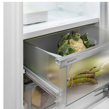
Priečinko na ovocie a zeleninu

Milujete ryby? Vo vašej chladničke Liebherr zostanú čerstvé! Pretože v priečinku Fish & Seafood uskladníte ryby a morské plody pri optimálnej teplote -2 °C rovnako profesionálne, ako u predajcu rýb. Ľubovoľne si prispôbte veľkosť zóny -2 °C – a na zvyšnej ploche uskladníte mäsové a mliečne výrobky pri optimálnych 0 °C. LED indikátor signalizuje, či je zóna -2 °C práve aktívna.