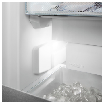
LED osvětlení IceMaker

Váš Liebherr je v kuchyni – ale pokud chcete, může být také kdykoli na internetu: Integrovaný SmartDeviceBox otevírá dveře všem výhodám Smart Home. Jednoduše zastrčte do zásuvky, zapněte a připojte svůj Liebherr k síti přes WLAN.