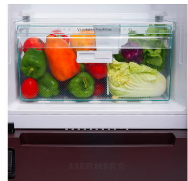
Bigger Vegetable Basket with Pullout @ 90degree door opening

Die LED-Deckenbeleuchtung beleuchtet den Innenraum von oben - für eine gute Übersicht Ihrer Lebensmittel. Der Extra-Lichtblick: Die LEDs sind vor den Glasplatten positioniert, sodass auch ein voller Kühlschrank gut beleuchtet wird.