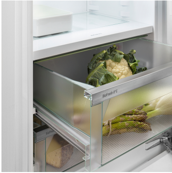
Fruit & Vegetable rekesz

Ropogós saláta vagy eper: az érzékeny élelmiszerek különleges törődést igényelnek, hogy tovább frissek maradjanak. Erről gondoskodnak a BioFresh rekeszek. A „Fruit & Vegetable rekeszben” 0 °C-hoz közeli a hőmérséklet. A tartós páratartalomnak és szoros zárásnak köszönhetően itt különösen jól érzik magukat a csomagolatlan gyümölcsök és zöldségek. Semmit nem kell beállítania.