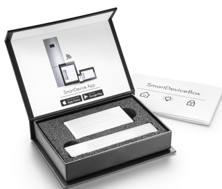
Utólag beépíthető SmartDeviceBox

A DuoCooling két teljesen elválasztott hűtőkörrel gondoskodik arról, hogy a hűtő- és fagyasztórész között ne történjen levegőcsere. Az élelmiszerek nem száradnak ki, és nincs szagátvitel. Ezáltal kevesebb dolgot kell kidobnia, ritkábban kell bevásárolnia, többet spórolhat, és tovább élvezheti az ízeket.