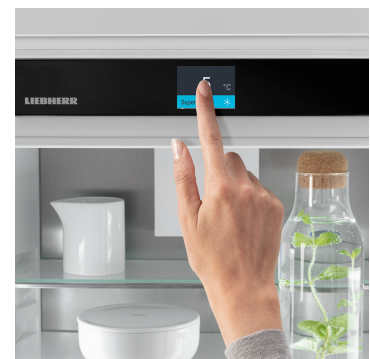
Touch & Swipe kijelző

Az optimálisan megvilágított belső térben örömet fogja lelni: a LightTower elemek előtérbe helyezik az élelmiszereket, és úgy vannak elhelyezve, hogy mindig maradéktalanul megvilágítsák a feltöltött hűtőszekrényt. Mivel a LightTower elemek az oldalfalak síkjában vannak beépítve, több hely marad az élelmiszerek számára.